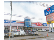
コーナンホーム土佐店 車約2分