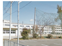
高岡中学校 徒歩約15分