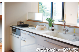
キッチン (グレードアップ)