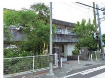
高岡第一小学校 徒歩約6分