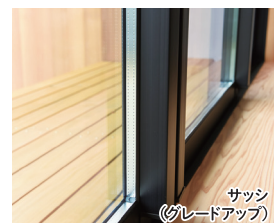
サッシ (グレードアップ)