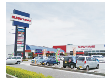
サンニーマート高岡店 車約3分