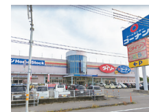
コーナンホーム土佐店 車約2分