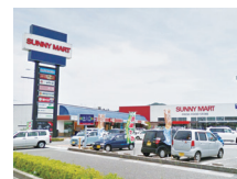
サンニーマート高岡店 車約3分